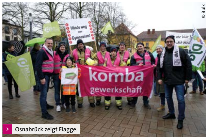
Osnabrück zeigt Flagge.

Erwartungsvoll schauen nun alle Beteiligten auf die bevorstehende dritte Tarifrunde vom 7. bis 9. Dezember. Es bleibt abzuwarten, ob es für den öffentlichen Dienst der Länder einen ähnlich guten Abschluss wie bei den Tarifverhandlungen am Anfang dieses Jahres für den öffentlichen Dienst von Bund und Kommunen geben wird.