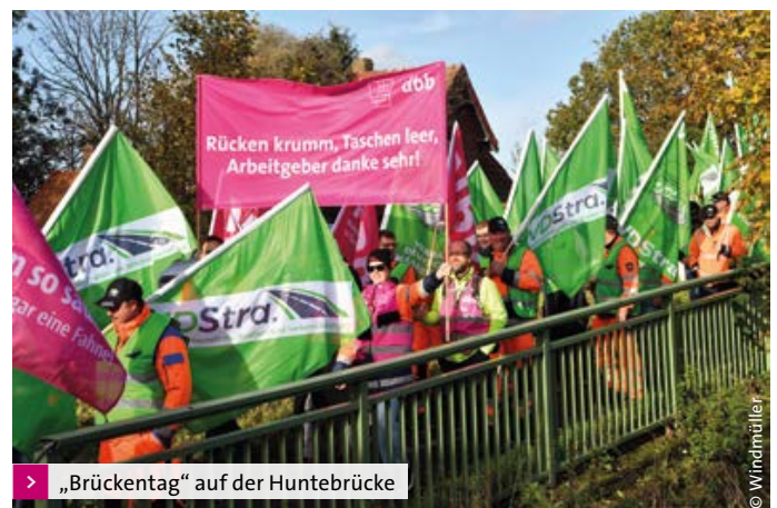
„Brückentag“ auf der Huntebrücke